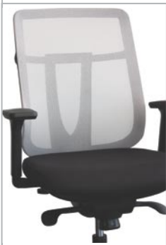
(LGY) Gris Pale