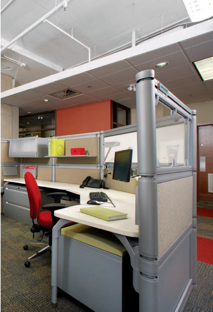
Poste de directeur